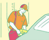
SS事業部 (サービスステーション勤務)