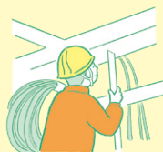
ボイラー等（配管含む） 設備技術者