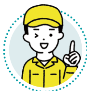
Hさん 出身校：気仙沼向洋 高校