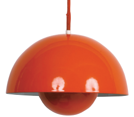
●ヴェアナ・バント ペンダント・ランプ〈フラワーポット〉 [1968] ルイス・ポールセン 個人蔵