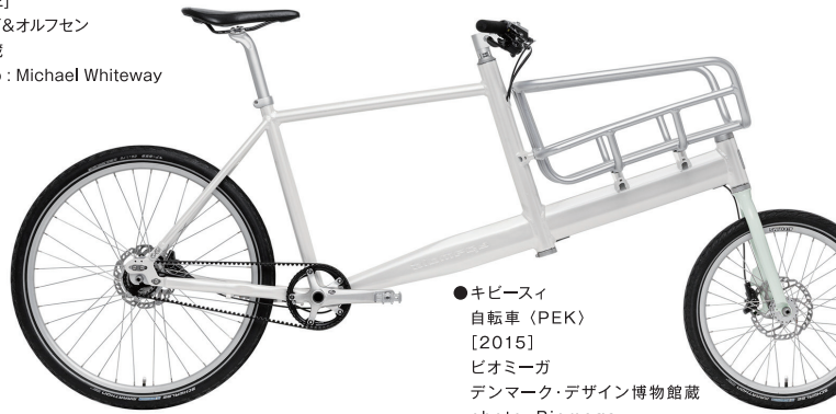
●キビーサイ 自転車〈PEK〉 [2015] ピオミーガ デンマーク・デザイン博物館蔵