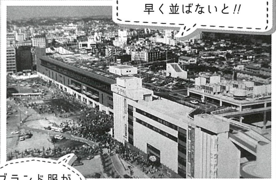
仙台 S-PAL(エスパル)開店(昭和53年3月)