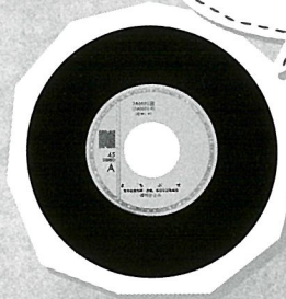
レコード[所蔵:当館]