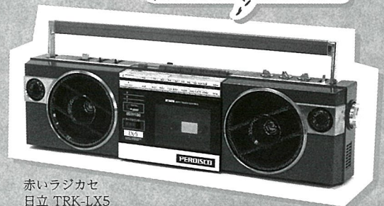
赤いラジカセ 日立 TRK-LX5 [所蔵:茨城県立歴史館]