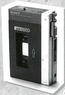
初代ウォークマン ソニー TPS-L2 [所蔵:当館]