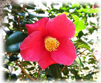
春「つばき」(稲ヶ崎公園)