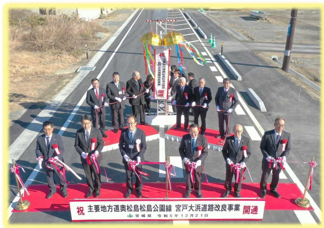
写真 テープカットおよびくす玉開披状況