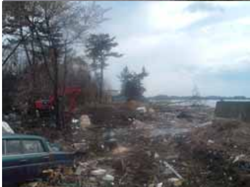
長石海岸堤防決壊