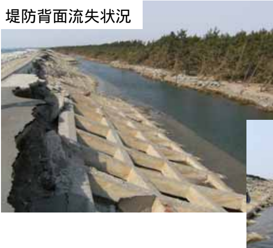
堤防背面流失状況