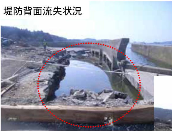
堤防背面流失状況