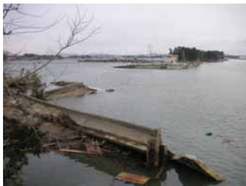
定川右岸堤防の決壊