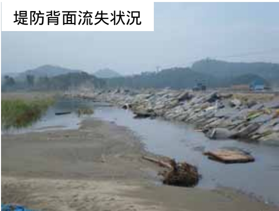
堤防背面流失状況