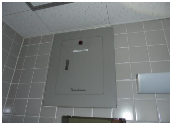
排風機盤(3階・映写室)