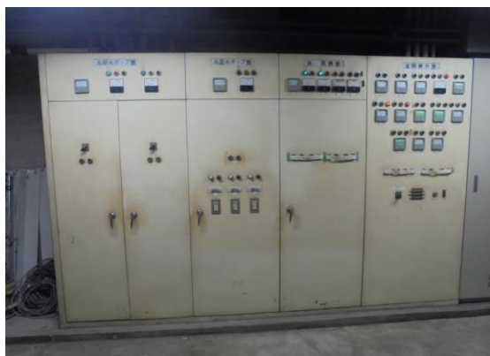
動力・制御盤(機械室)