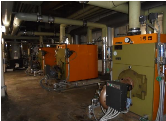
空調用ボイラー(蒸気)