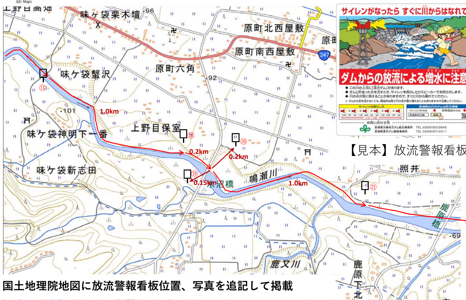
【見本】放流警報看板