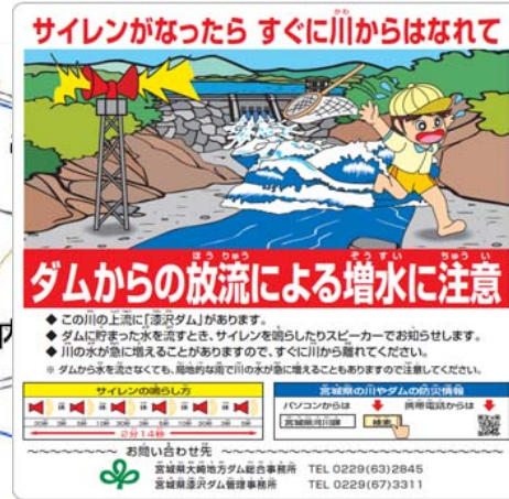
【見本】放流警報看板