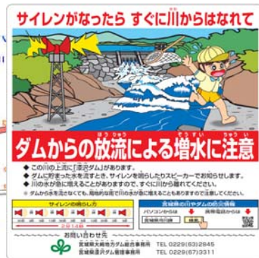
【見本】放流警報看板