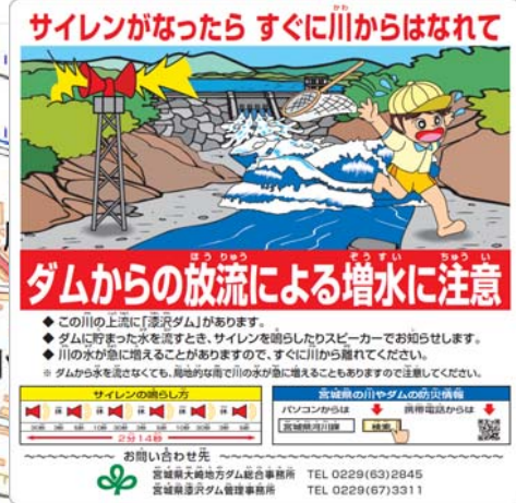
【見本】放流警報看板