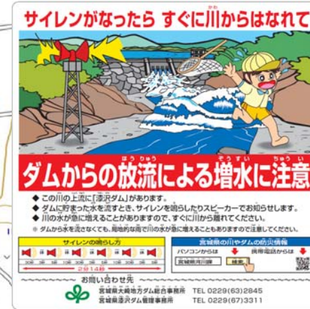
【見本】放流警報看板