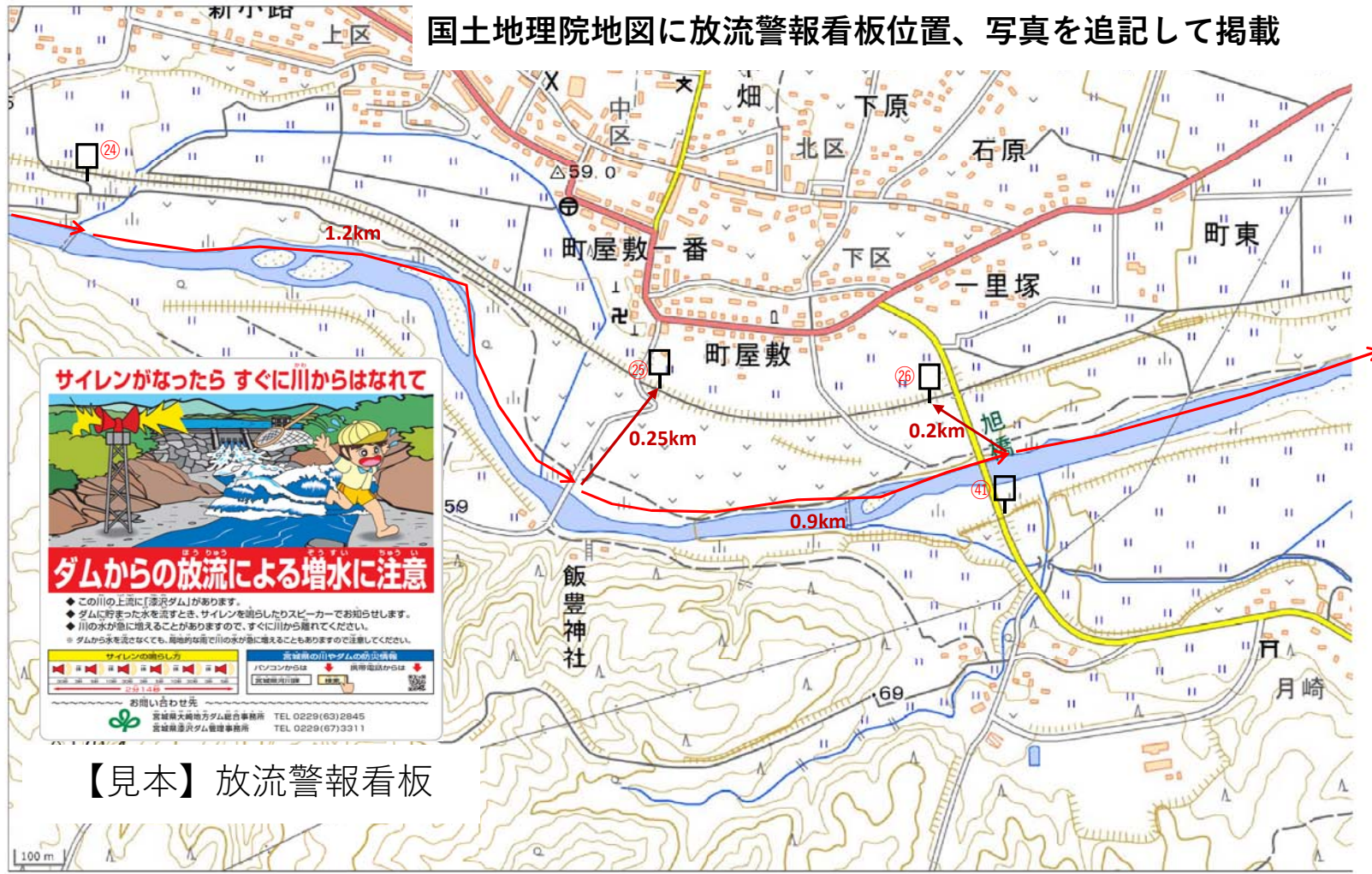
【見本】放流警報看板