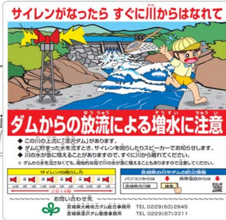
【見本】放流警報看板