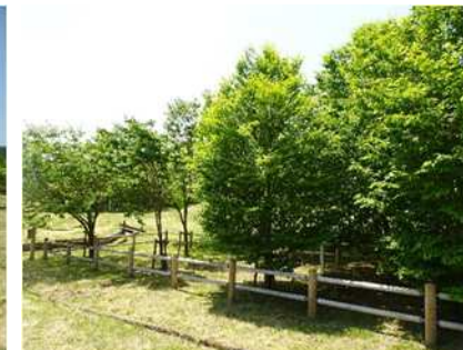
天皇皇后両陛下のお手植え木の状況：ブナ、オヤマザクラ