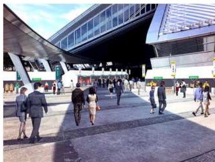
「おもてなしコーナー」イメージ

式典会場に「おもてなしコーナー」を設置し、特産品の展示・販売や観光情報を発信します。