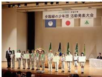
第46回全国育樹祭（茨城県）