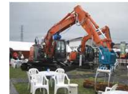
第46回全国育樹祭（茨城県）