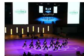
第46回全国育樹祭（茨城県）