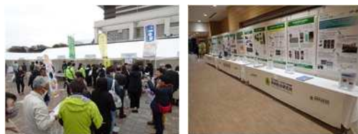
第46回全国育樹祭（茨城県）のおもてなしエリア