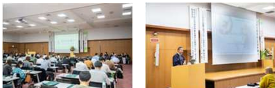
第45回全国育樹祭（大分県）