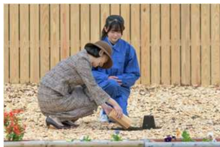
秋篠宮皇嗣妃殿下によるお手入れ（施肥） 第46回全国育樹祭（茨城県）