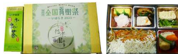
第46回全国育樹祭（茨城県）の配布弁当