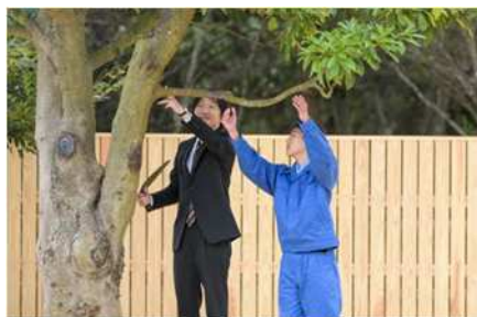
秋篠宮皇嗣殿下によるお手入れ（枝打ち） 第46回全国育樹祭（茨城県）