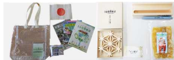
第46回全国育樹祭（茨城県）の式典参加者配布用品等