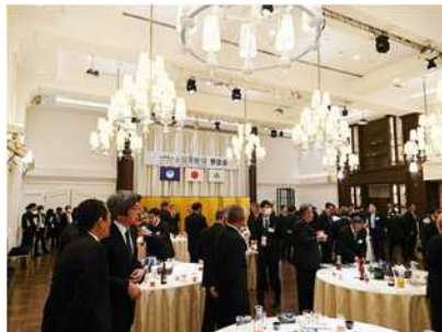
第46回全国育樹祭（茨城県）