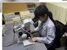
▲調査・同定の様子