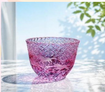
サンドブラストアート