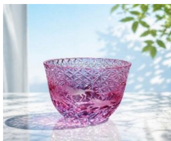
サンドブラストアート