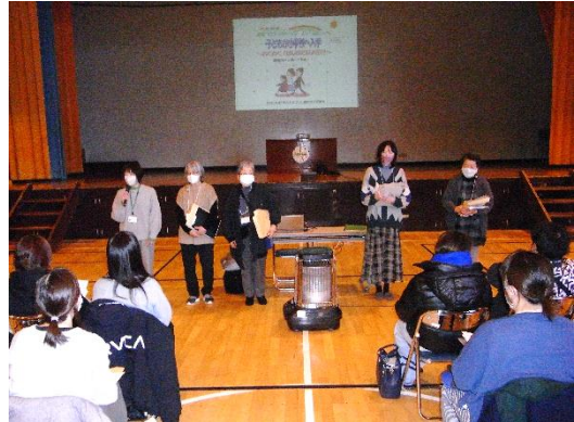
② ファシリテーターあいさつ