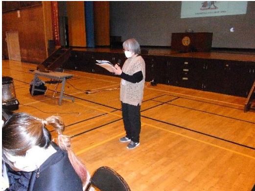
③ みんなのルール発表