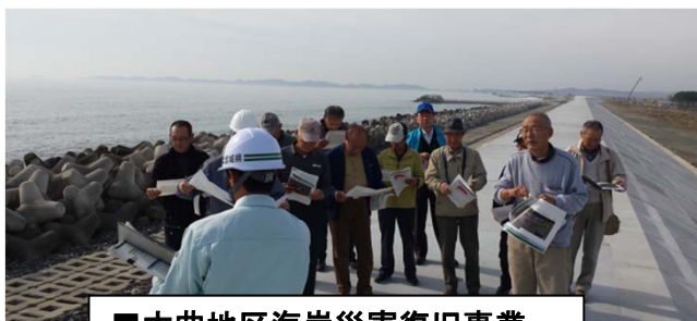
■大曲地区海岸災害復旧事業

平成27年11月17日に大曲地区海岸と定川の災害復旧事業について現場説明会を開催し、東松島市大曲地域自主防災連絡協議会の皆さんに事業の必要性や堤防の構造、工事の進捗状況について、理解を深めていただくことができました。