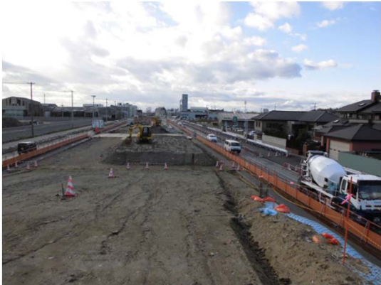
【(都)門脇流留線 魚町工区施工状況】