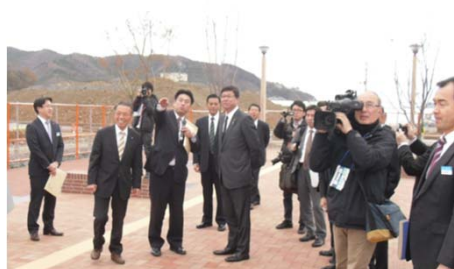
女川中心部被災市街地土地区画整理事業の視察状況