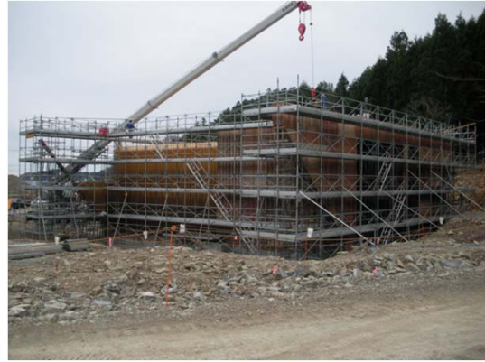
【(国)398号 御前浜工区 函渠工施工状況】