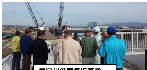
■定川災害復旧事業