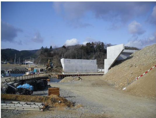
【(国)398号 女川市街地工区 女川橋施工状況】

○問い合わせ先 宮城県東部土木事務所 企画担当チーム TEL:0225-95-1151 http://www.pref.miyagi.jp/soshiki/et-dbk/ E-mail: et-dbk@pref.miyagi.jp