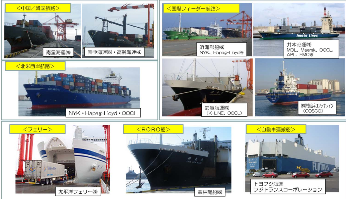
仙台塩釜港(仙台港区)コンテナ定期航路一覧

◎外資コンテナ航路は、北米西岸航路（週1便）、中国／韓国航路（週3便）の計4航路（週4便）、国際フィーダー航路は、8航路（週11便） ◎フェリー、RORO船、自動車運搬船による国内航路により全国各地へ輸送可能。