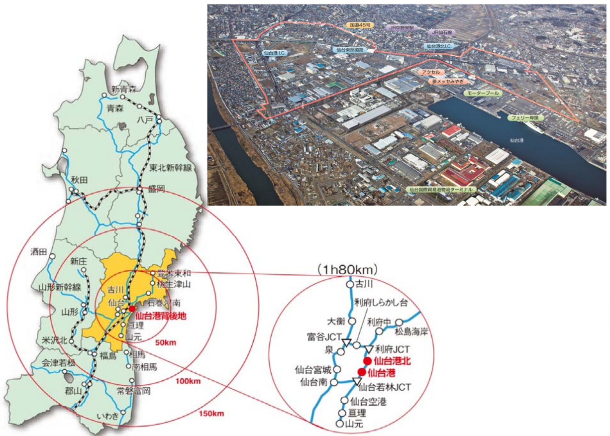
■ 高速道路利用による各地への距離と所要時間(80km/h)

また、東北新幹線や仙台空港の利用により、日帰りビジネスも充分可能で、日々スピードアップするビジネスシーンに対応します。