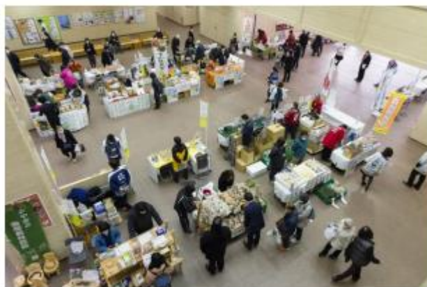
イメージ (2/1~5 開催記念イベントの様子)

※状況により、出店者に変更が生じる場合がありますので、あらかじめ御了承願います。