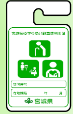
車いす 使用者以外用