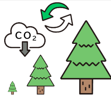
二酸化炭素吸収量の増加