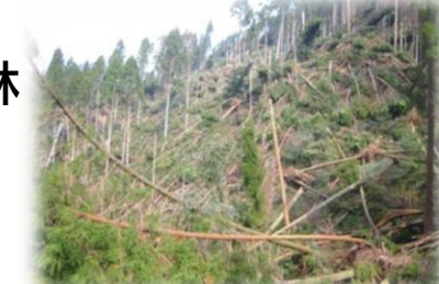
風倒被害が発生した未整備森林

森林環境譲与税とみやぎ環境税をそれぞれの目的に従って活用し、「森林の公益的機能の向上」を図る