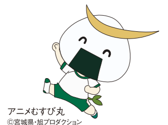
アニメむすび丸 ©宮城県・旭プロダクション

ルルブルは、みなさんが元気に成長するために必要な「しっかり寝ル・きちんと食ベル・よく遊ブで健やかに伸びル」から取った言葉です。1日3食を「きちんと食ベル」だけでなく、体を大きくしたり、記憶力をアップさせるために「しっかり寝ル」こと、体力をつけ、脳のはたらきをよくするために、外で「よく遊ブ」ことも、とても大切です。