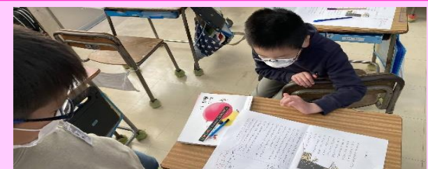
第4回「亘理小の国語の授業(3、6年)」

詩「月夜の浜辺」、古典「竹取物語」の二つの授業実践が行われました。それぞれの授業に生徒の実態を捉えた授業者の工夫があり、それが生徒の主体的な学びにつながっていました。