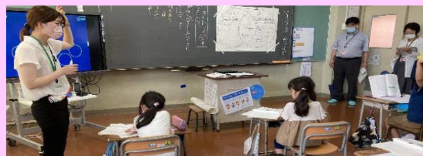
第2回「高屋小の国語の授業(2年)」

「自然のかくし絵」の授業実践が行われました。交流活動では、ICT を活用し、児童が自分の考えを伝えやすくなる工夫がなされていました。