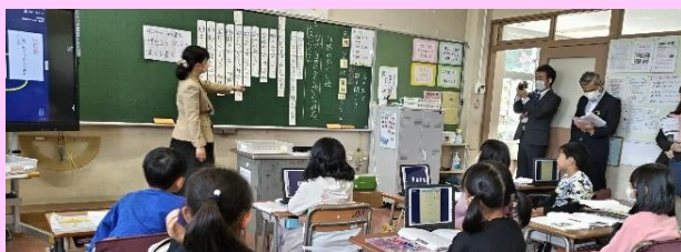
第1回「吉田小の国語の授業(3年)」

「自然のかくし絵」の授業実践が行われました。交流活動では、ICT を活用し、児童が自分の考えを伝えやすくなる工夫がなされていました。