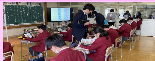
第3回「亘理中の国語の授業(1年)」

「サツマイモのそだて方」の授業実践が行われました。シンキングツールを効果的に活用することで、二つの文章の良さについて児童が考えを持ちやすくなるように工夫された授業でした。