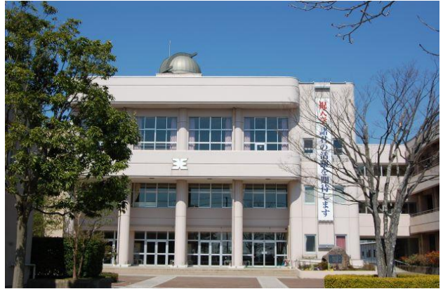
英語科 online 海外交流授業