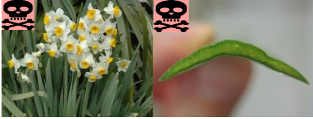
スイセン（花と葉） スイセン（葉の断面）