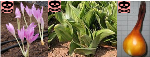
イヌサフラン(左から花・葉・球根)