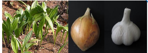
ギョウジャンニンク