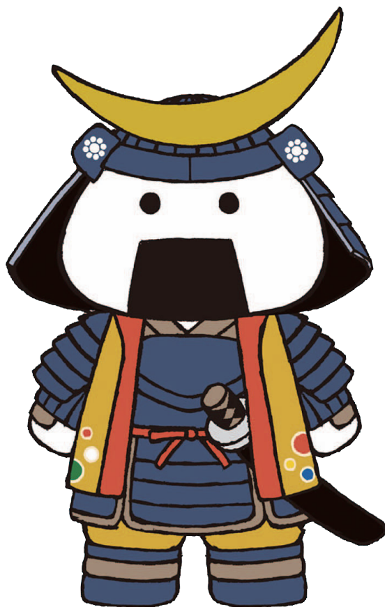
仙台・宮城観光 PR キャラクター 「むすび丸」