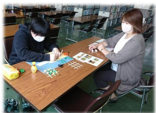
もの作り交流（高校）

令和2年度事業費：413,552,547円（うち基金活用額：119,260,528円）