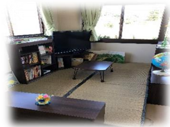
大郷町「とらいあんぐる」