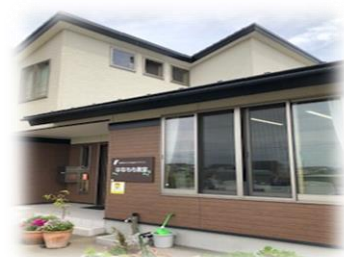
名取市「はなもも教室」