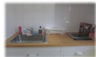
料理等を訓練できる ミニキッチン

令和2年度事業費：20,571,224円（うち基金活用額：10,075,224円）