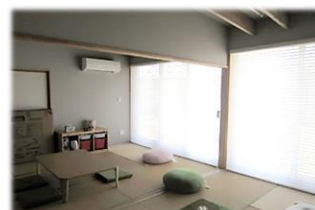
親子が過ごす居室