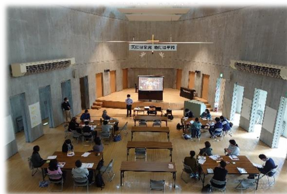
里親を対象とした研修会の様子

令和2年度事業費：32,970,986円（うち基金活用額：14,952,986円）