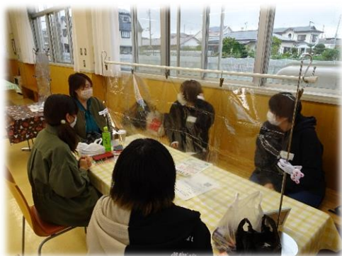
生徒の相談等に対応（高校）