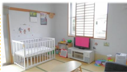
親子が過ごす居室