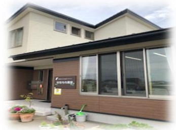
名取市「はなもも教室」