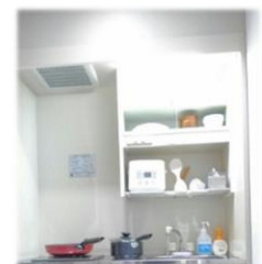
料理等を訓練できる ミニキッチン

令和4年度事業費：20,143,350円(うち基金活用額：8,535,350円)