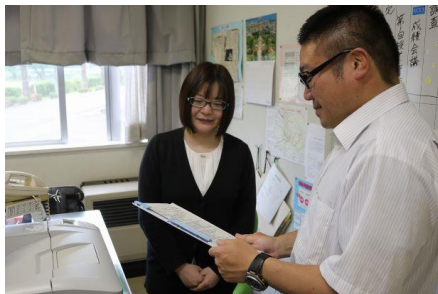
教職員との打合せ（高校）