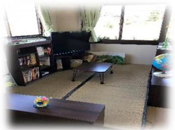
大郷町「とらいあんぐる」