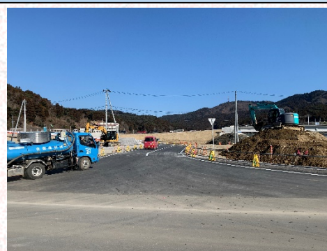
①牡鹿支所方面を望む