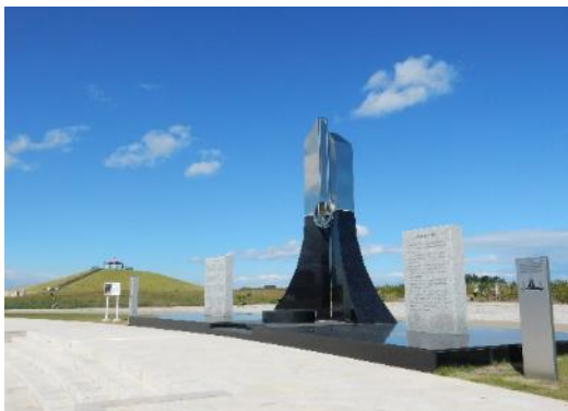
復興のシンボル「千年希望の丘」

まち・ひと・しごと創生寄附活用事業に関連する寄附を行った法人に対する特例（地方創生応援税制）