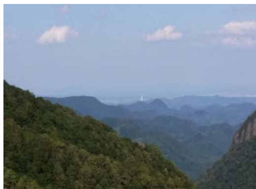
二口林道からの眺望（仙台方向）