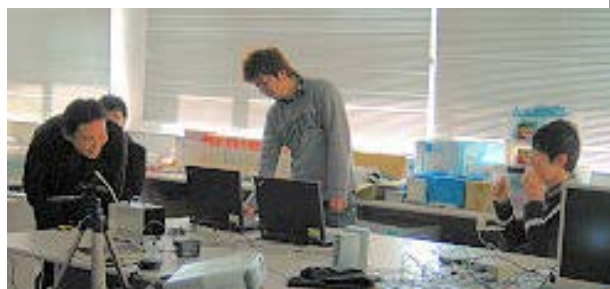
企業でのインターンシップ風景（実習）