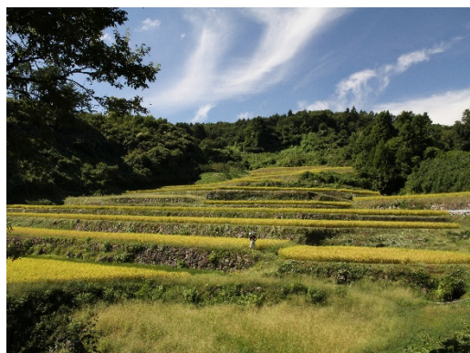
日本棚田百選 丸森町「大張沢尻棚田」