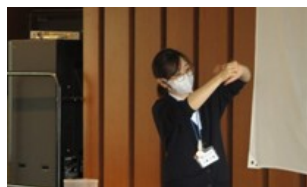
←実技（正しい手洗いの方法）