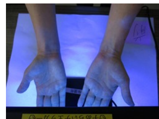
実際に・・・手洗いチェッカーで確認