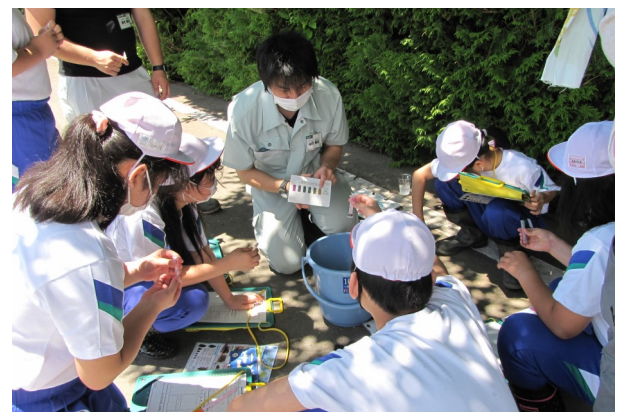
パックテストを用いた水質調査の様子