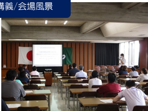
3密に配慮し、ソーシャルディスタンスを保持