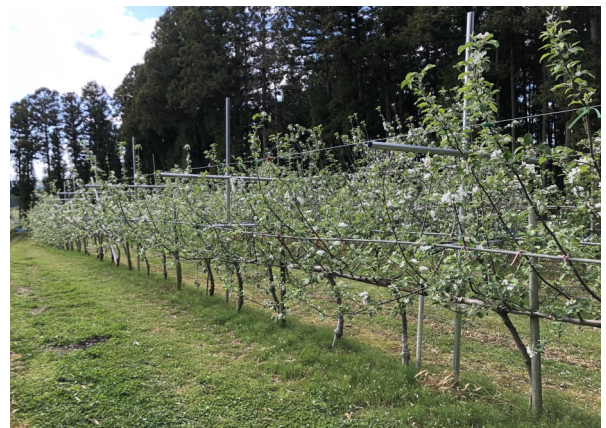
ジョイント後の様子

農業振興部（登米農業改良普及センター）では、生育調査や樹形管理等の定期的な情報提供を通じ、ジョイント栽培の普及定着を支援していきます。