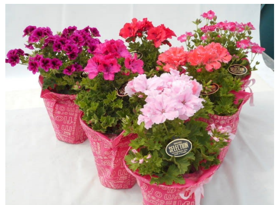
大変好評だったペラルゴニウム