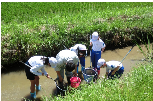
生き物調査の様子

水質調査では、水のpH（水素イオン指数）やCOD（有機物の酸素使用量）により色が変わるパックテストに、子どもたちは熱心に取り組む中で地域の環境についても学んでいました。