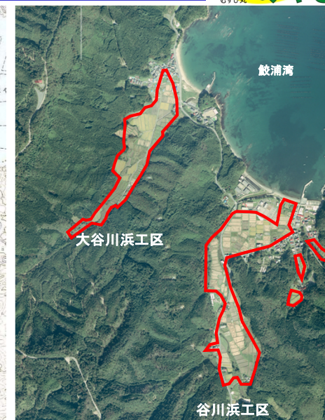
※位置図、空中写真は国土地理院提供