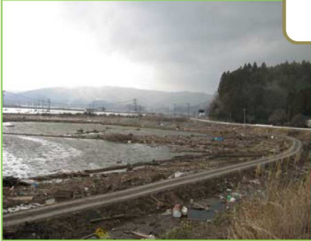
海水・ガレキ等の侵入