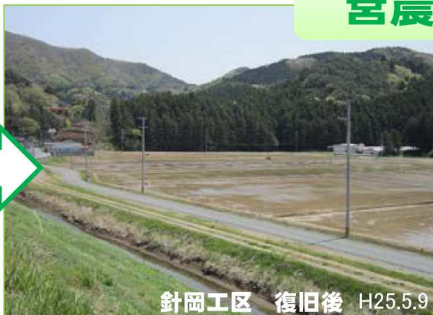
針岡工区 復旧後 H25.5.9