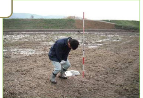
津波による土砂の堆積