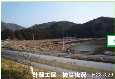
針岡工区 被災状況 H23.3.29