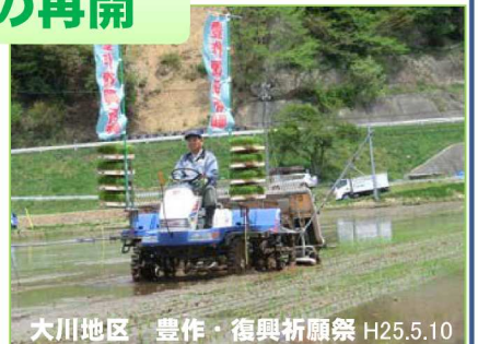
大川地区 豊作・復興祈願祭 H25.5.10