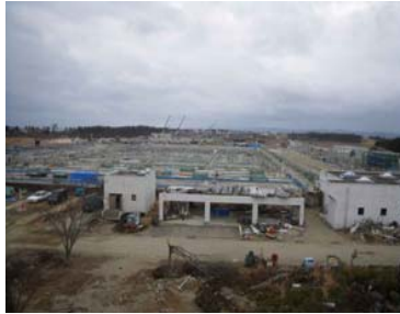
処理場 遠景（下図、矢印）