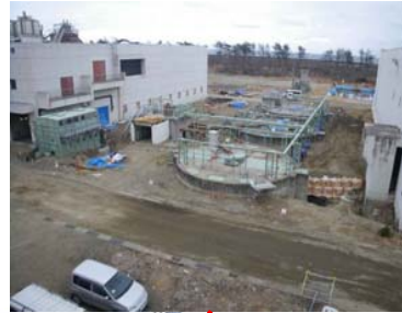
汚泥濃縮タンク付近