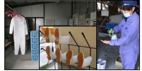
専用の服や靴の使用、手指消毒