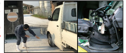
車両はタイヤだけでなく、 泥よけの内側まで消毒 し、 フロアマットの交換 や ペダル等車内も消毒