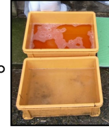
推奨される踏込消毒槽の設置方法！