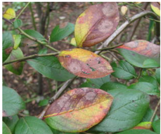
図2 発病葉の葉枯れ症状