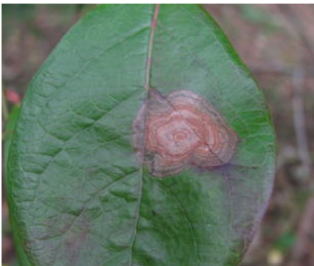
図1 葉の輪紋状の大型病斑