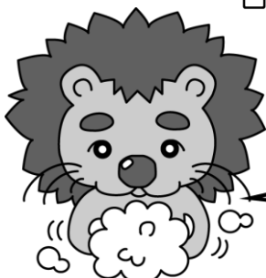
石巻保健所 オリジナルキャラクター 『てあらいおん』

『塩素系（ハイターなど）消毒剤』のくわしい作り方は、石巻保健所のホームページをみてね！