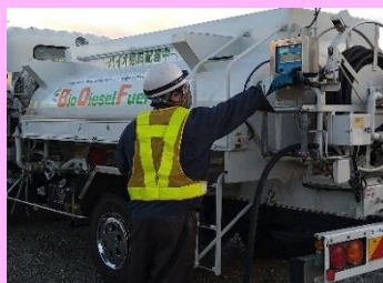
タンクローリー による配送