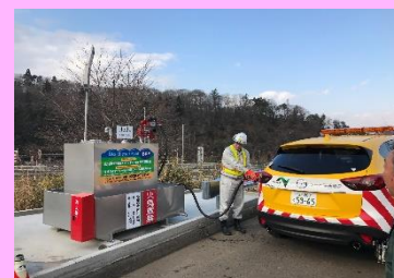
簡易給油タンク も利用可能