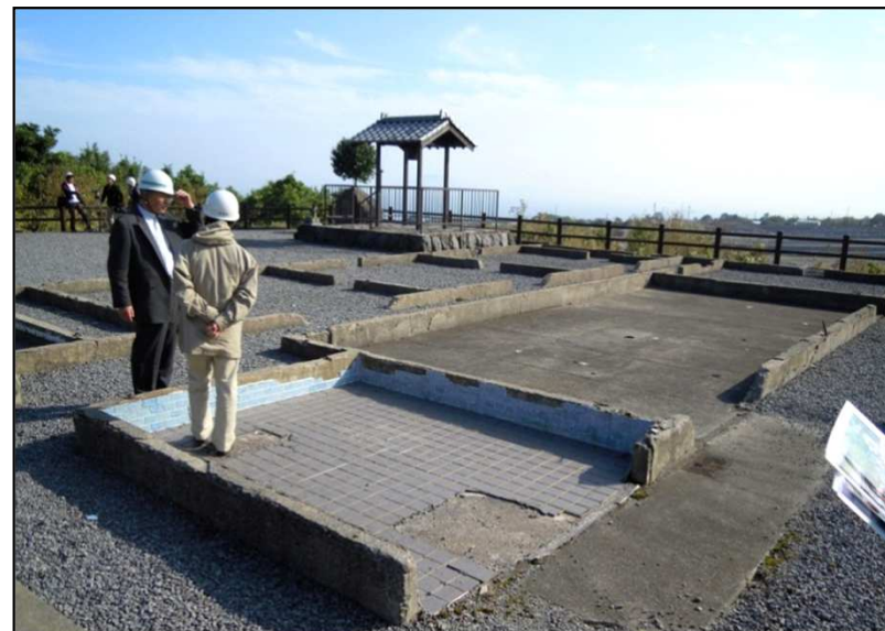
火砕流で多くの犠牲者がでた施設の基礎が保存