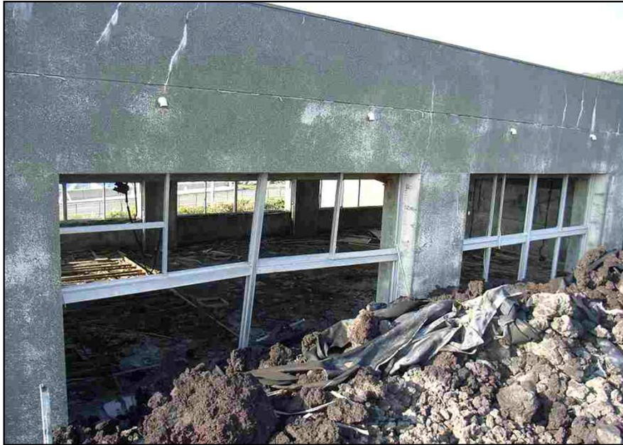
溶岩流に埋没した学校