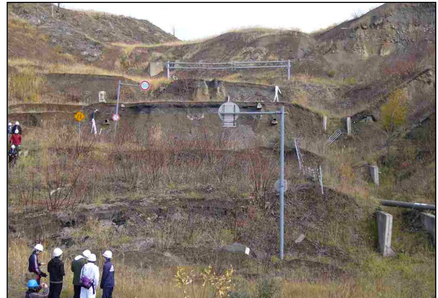
地盤が隆起して道路が階段状に