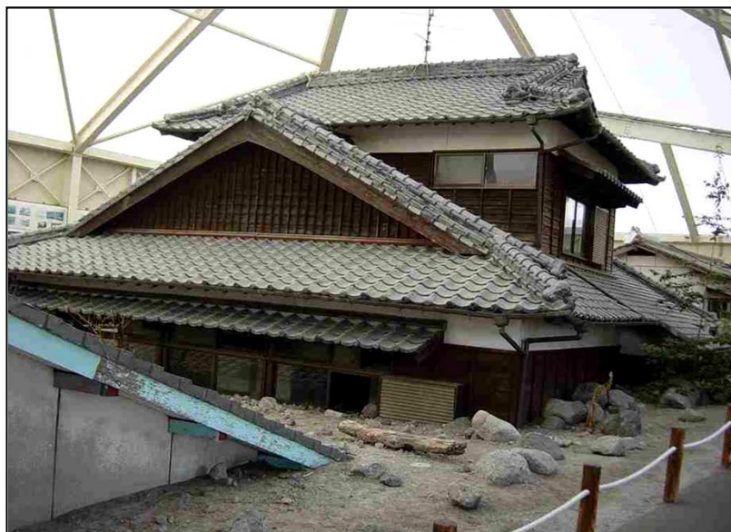
土石流で埋没した住宅群 (隣接地には「道の駅」が建設された)