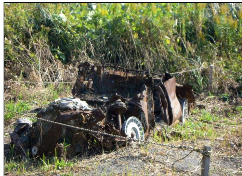
火砕流で焼失した自動車