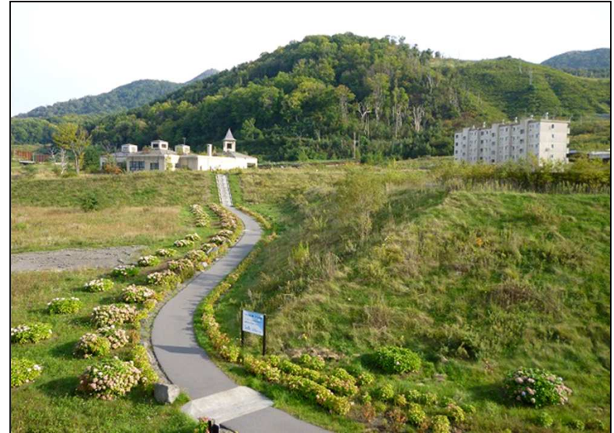
噴石の跡が残る公営浴場と町営住宅