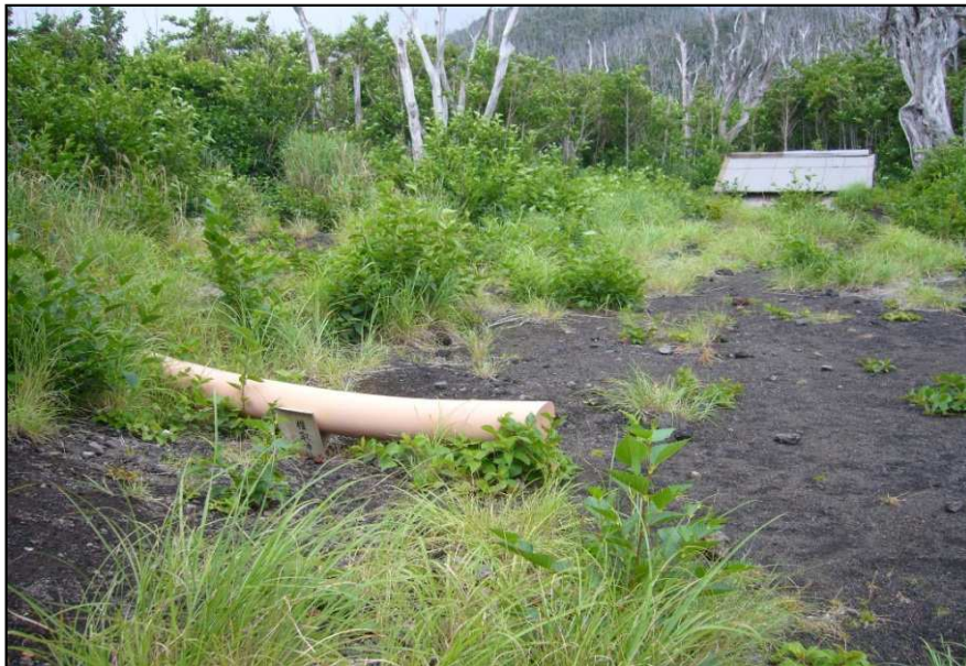
土石流で埋没した鳥居とお社