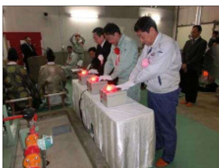
2月26日 県南浄化センター汚泥燃料化施設 試運転開始