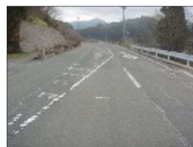
左：応急復旧後 右：復旧後