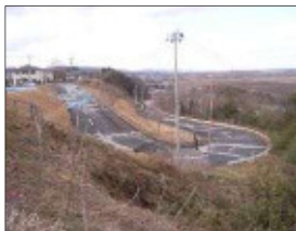
左：応急復旧後 右：復旧後

仙台塩釜港各港区で荷役に利用される上屋は、震災で大きく被災したが、上屋6棟(仙台港区1棟、塩釜港区4棟、石巻港区1棟)の復旧工事に年度内に着手する。