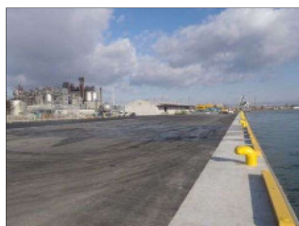
仙台塩釜港石巻港区 中島3号岸壁