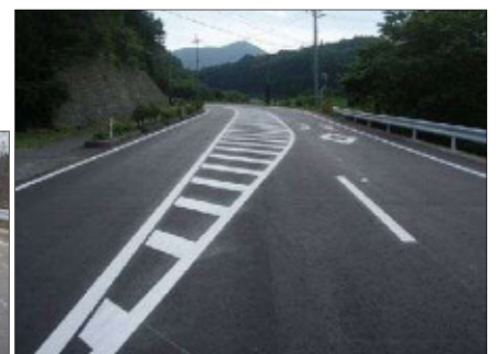
2月26日（主）気仙沼本吉線 被災5箇所の本復旧工事完了