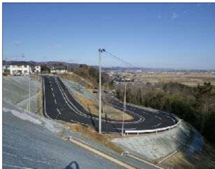
2月1日 山元町太陽ニュータウン町道・浅生原下宮前南線（県が山元町より受託）