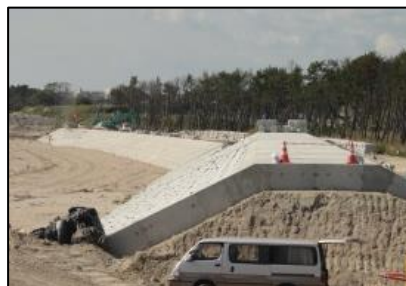
菖蒲田海岸 堤防工事状況（七ヶ浜町）