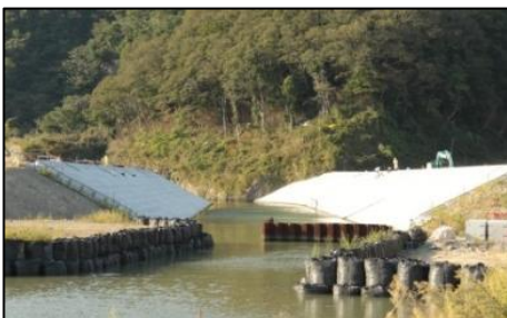
女川 護岸工事状況（女川町）