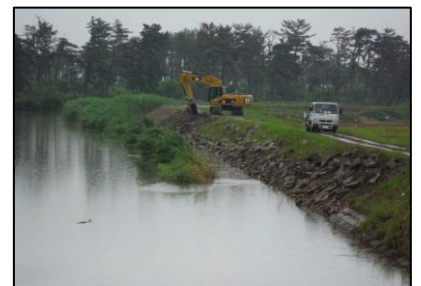
五間堀川 被災した構造物の取壊し状況（岩沼市）