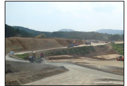
戸倉地区 造成工事状況（南三陸町）

（※住宅等建築工事可能とは、土地を購入又は借地し、建築工事の準備が整った状態のことを示す）