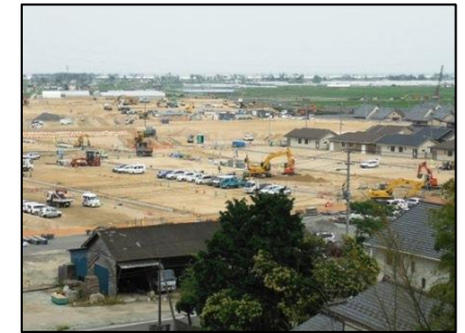
新山下駅周辺地区 造成工事状況（山元町）