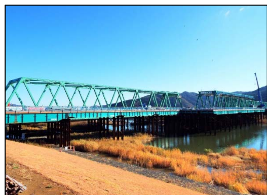
新北上大橋 災害復旧工事状況 (石巻市)