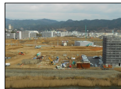
南気仙沼地区 （気仙沼市）