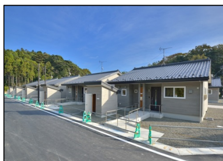
寒風沢地区（塩竈市）