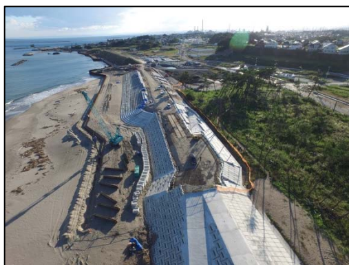
菖蒲田地区海岸 災害復旧工事状況 (七ヶ浜町)