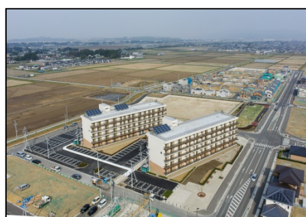
東矢本駅北地区（東松島市）