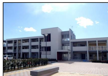
坂元道合地区 （山元町）