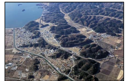
野蒜北部丘陵地区 （東松島市）