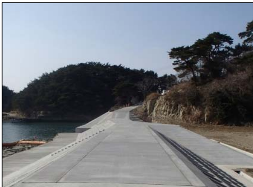
鱒ヶ淵地先海岸 (東松島市)