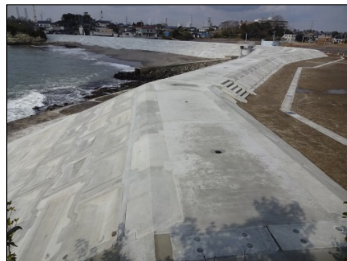
松ヶ浜地区海岸 (七ヶ浜町)