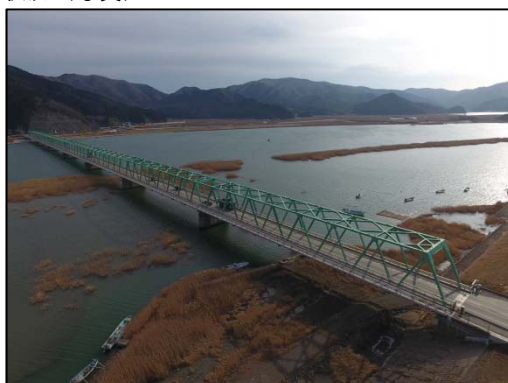
新北上大橋 (石巻市)