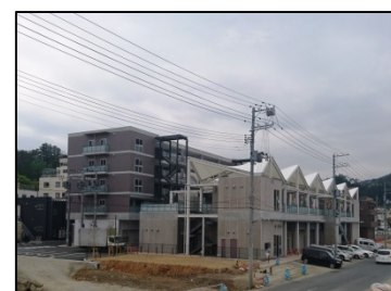
南町二丁目地区 (気仙沼市)