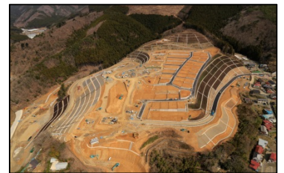
宮ヶ崎地区 (女川町)