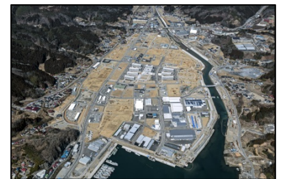
鹿折地区 (気仙沼市)