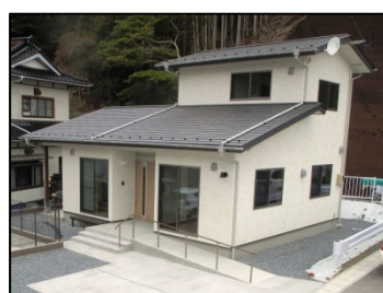
小屋取地区 (女川町)