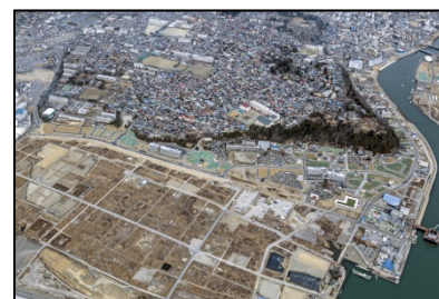
新門脇地区 （石巻市）