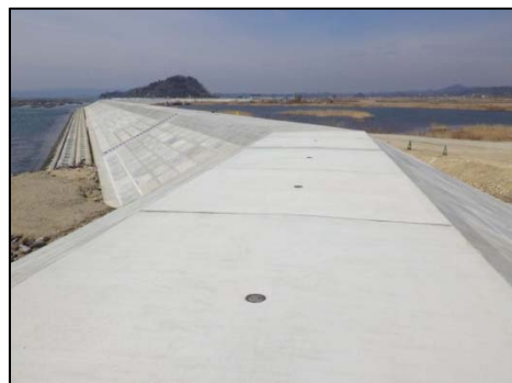
東名地先海岸 （東松島市）