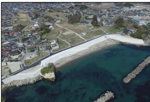
松ヶ浜地区海岸 （七ヶ浜町）