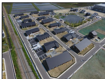
新渡波地区（D街区） （石巻市）