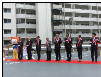
災害公営住宅 整備完了・入居式 （気仙沼市）