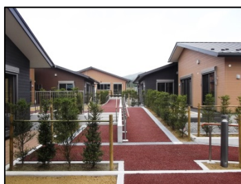
にっこり団地南地区 （石巻市）