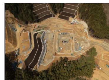
小乗浜地区（女川町）