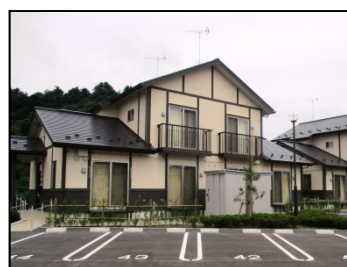
野蒜北部丘陵地区 （東松島市）