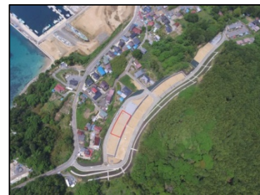
鮎川浜地区（熊野団地） （石巻市）