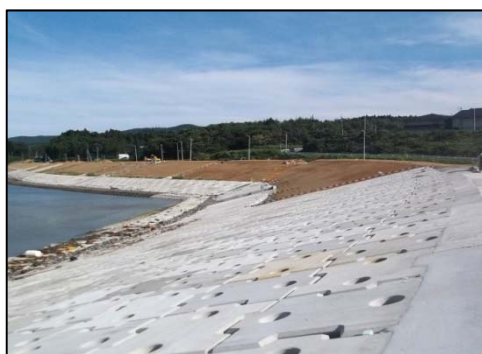
戸倉地区海岸 （南三陸町）