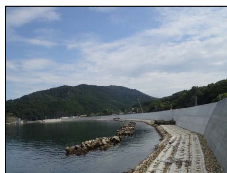
大原地区海岸 （石巻市）