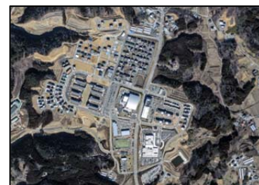
志津川東地区（南三陸町）