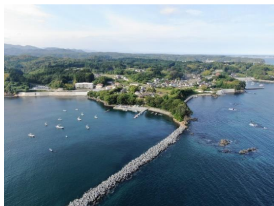
志津川海岸荒砥地区海岸（南三陸町）