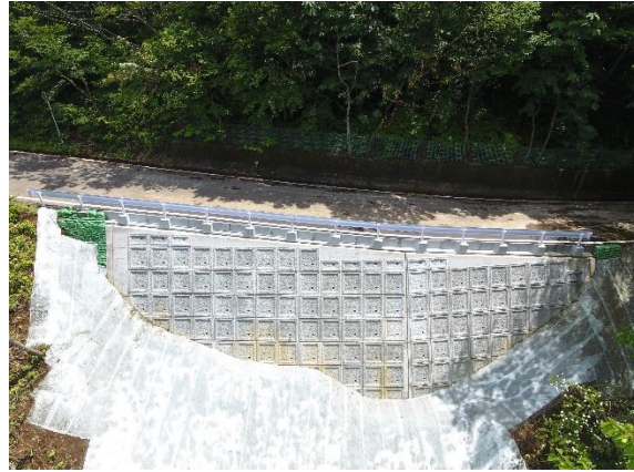
(一) 青根蔵王線 (柴田郡川崎町)