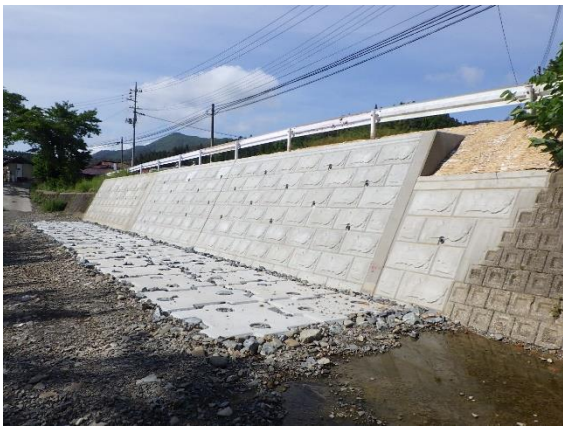
(主) 気仙沼陸前高田線 (気仙沼市)