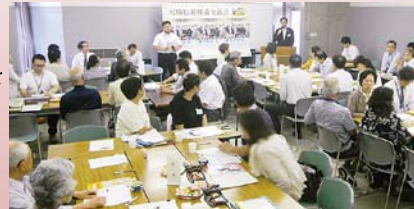
昨年度の交流会の様子

【問い合わせ】震災復興推進課 復興推進第二班 電話 022-211-2408 電子メール fukusuif2@pref.miyagi.jp